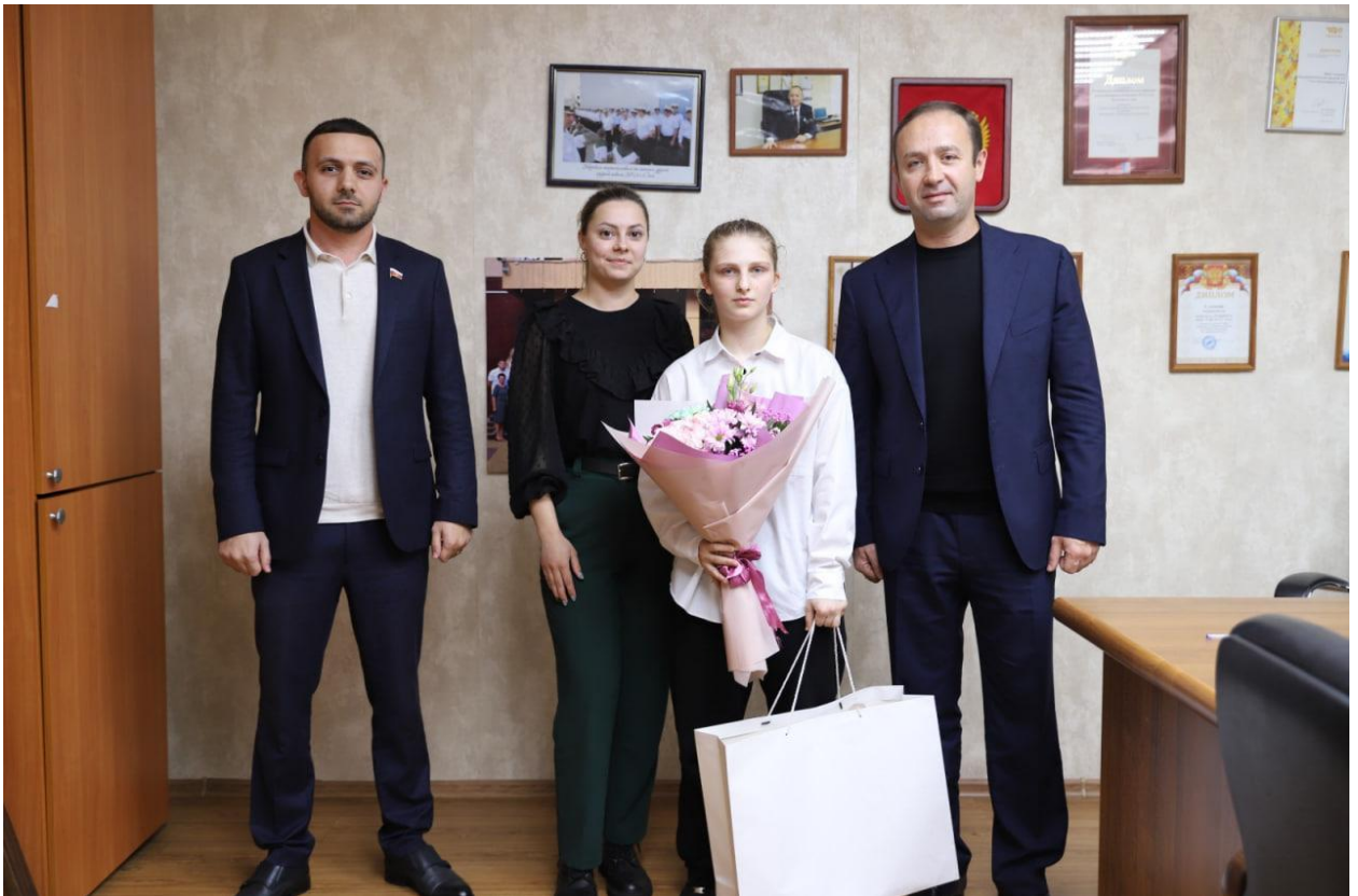
Организованы подарки инвалидам и ветеранам округа к Новому году. Организованы детские праздники на День защиты детей, 1 сентября, Новый год.